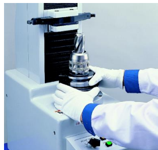
② ツールをクランプする