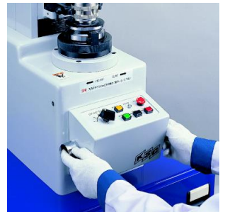
④ スイッチを押してチャックを締める

※締め付けナットの形状が異なる場合でも、爪の交換で対応できます。 ※ツールの先端をプリセッタに押し当て、その場で締めつけが可能です。(NW-A50)