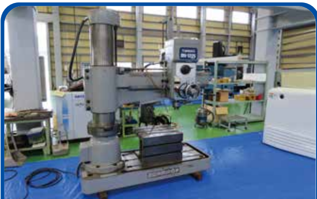
1225mmラジアルボール盤 (岡田メカニカ) 1991年 RH-1225 158万円 税込173.8万円 (高崎)