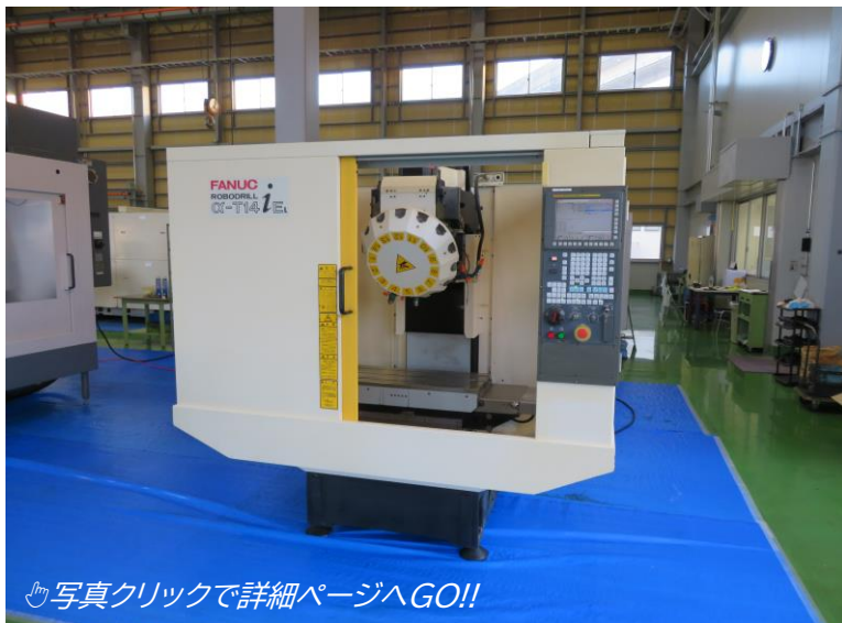
写真クリックで詳細ページへGO!!