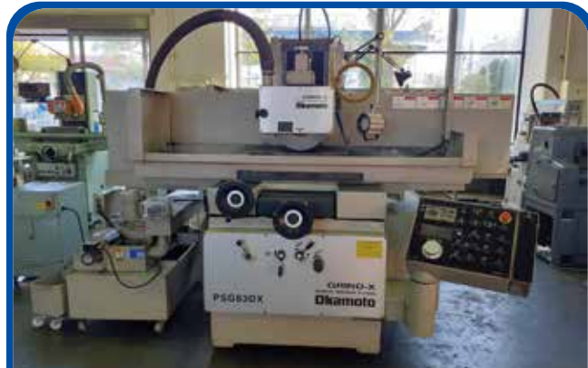
600mm×300mm平面研削盤(岡本工作) 2013年 PSG-63DX 電源 FANUC-20iF 500万円 税込550万円 (足立)