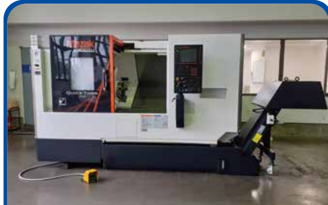
ドラム形NC旋盤(ヤマザキマザック) 2018年 QT350 電源 SMOOTHC 900万円 税込990万円 (足立)