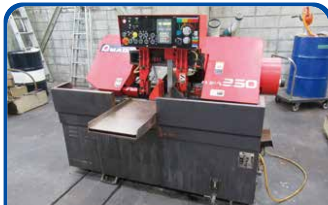
250mm全自動バンドソー (アマダ) 1997年 HFA-250 98万円 税込107.8万円 (大阪)

ホームページリニューアル → https://www.intexkikai.com