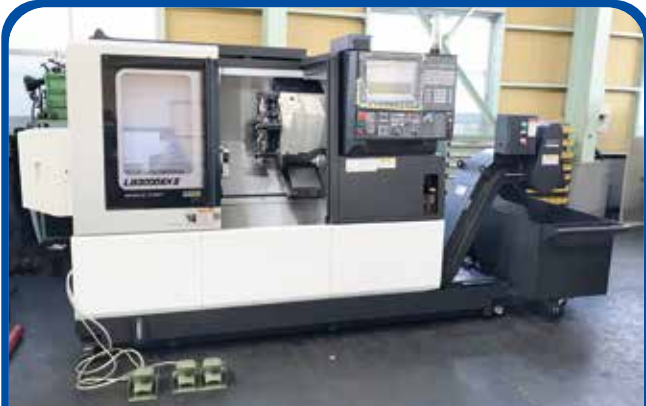
ドラム形NC旋盤(オークマ) 2019年 LB3000EX II 電源 OSP-P300LA 1080万円 税込1188万円 (名古屋)