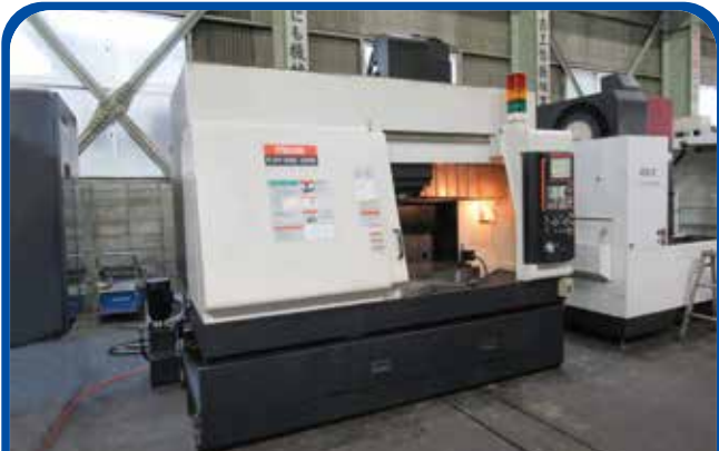
#40立形マシニングセンタ(ヤマザキマザック) 2008年 FJV250UHS 電源 MAZATROL-640M 580万円 税込638万円 (大阪)