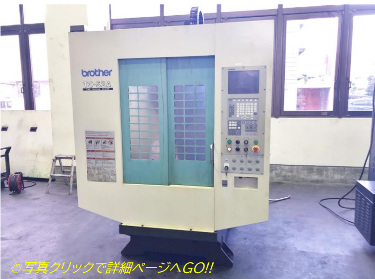
写真クリックで詳細ページへGO!!