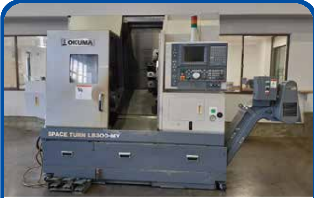
ドラム形NC旋盤(オークマ) (足立) 2005年 LB300MY 680万円 電源 OSP-E100L 税込748万円