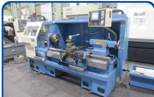
フラット形NC旋盤(大日金属) (大阪) 2012年 DL530x100 580万円 電源 FANUC-20i-TB 税込638万円