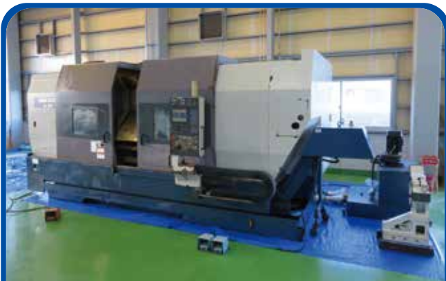
ドラム形NC旋盤(森精機) (高崎) 2000年 SL403B/2000 880万円 電源 MSG-501 税込968万円