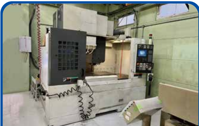
#40立形マシニングセンタ(森精機) (足立) 2006年 NV5000α1B/40 650万円 電源 MSX-501Ⅲ 税込715万円