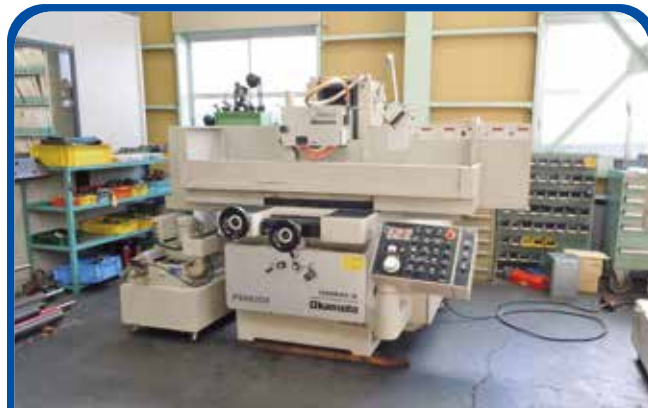
600mmx300mm (名古屋) 平面研削盤(岡本工作機械) 530万円 2013年 PSG-63DX 税込583万円

ホームページリニューアル → https://www.intexkikai.com