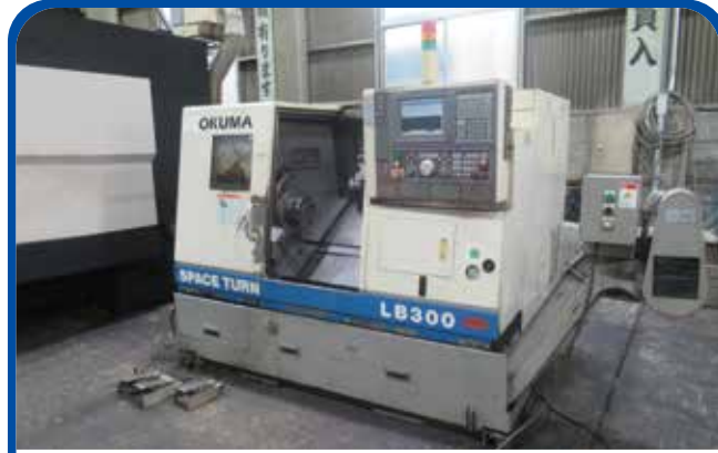
ドラム形NC旋盤(オークマ) (大阪) 2001年 LB300 338万円 電源 OSP-E100L(5<5<対話) 税込371.8万円