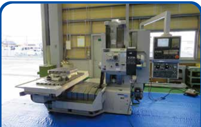
NC横形フライス盤(山崎技研) (高崎) 2006年 YZB-88NCR 電源 FANUC-20i-FB 895万円 税込984.5万円