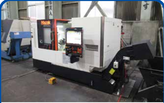
ドラム形NC旋盤(ヤマザキマザック) (大阪) 2017年 QT-200 電源 MAZATROL SmoothG 840万円 税込924万円