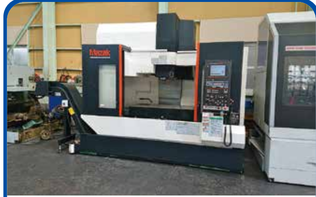
#40立形マシニングセンタ(ヤマザキマザック) (名古屋) 2012年 VCS530C 電源 MAZTROL-SMART 730万円 税込803万円