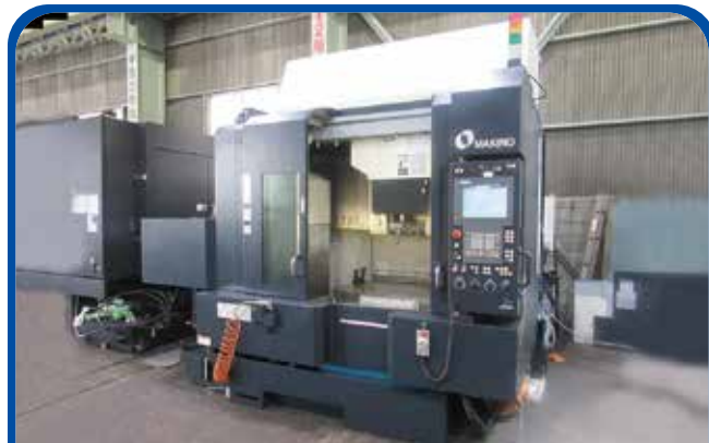
立形マシニングセンタ(牧野フライス) (大阪) 2014年 V56i 電源 Pro5 1680万円 税込1848万円