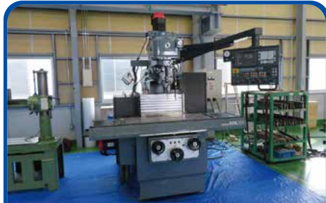
NCラム形フライス盤(牧野フライス) (高崎) 2001年 AVⅢNC-85 電源 Pro.A(FANUC) 280万円 税込308万円