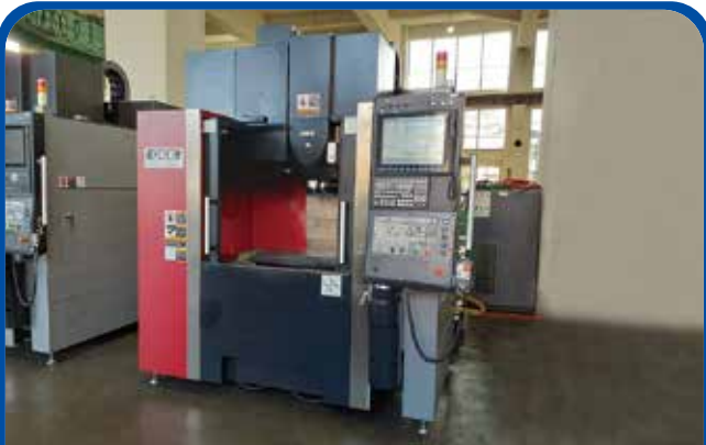
#40立形マシニングセンタ(OKK) (足立) 2017年 VM43R 電源 Neomatic730 900万円 税込990万円