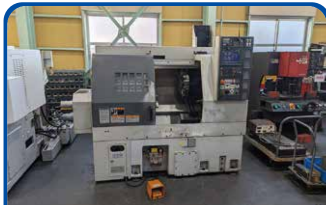
ドラム形NC旋盤(森精機) (名古屋) 2007年 CL1500T 制御 MSX-805Ⅲ 350万円 税込385万円