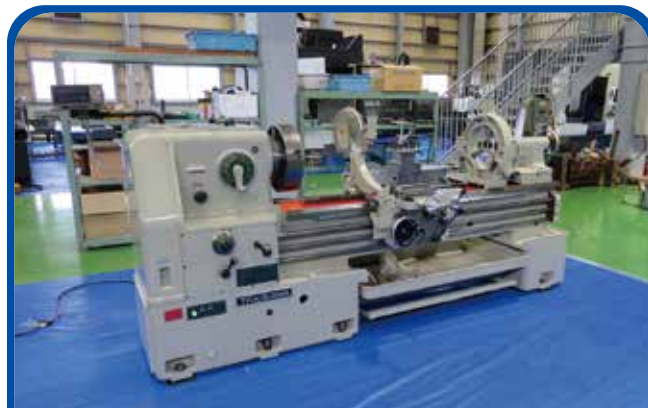
9尺切落付旋盤 (滝澤鉄工所) (高崎) 1992年 TAL600×1500G 348万円 税込382.8万円