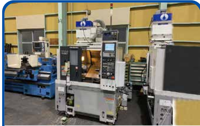
ドラム形NC旋盤(滝澤鉄工所) (名古屋) 2010年 TCC-2100L3 制御 FANUC-Oi-TF 438万円 税込481.8万円