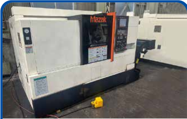
ドラム形NC旋盤(ヤマザキ) (大阪) 2011年 QTS200 制御 smart 680万円 税込748万円