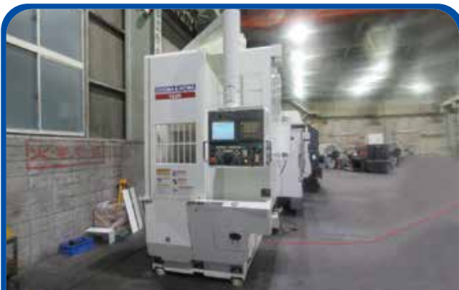
立形NC旋盤(大隈豊和) (大阪) 2002年 V40R 制御 FANUC-18i-T 580万円 税込638万円