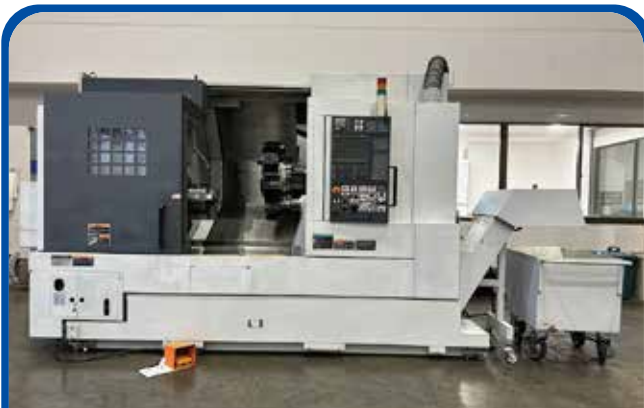
ドラム形NC旋盤(森精機) (足立) 2008年 NL3000Y/700 制御 MSX-850Ⅲ 980万円 税込1078万円