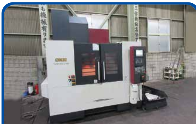
#50立形マシニングセンタ(大阪機工) (大阪) 2011年 VM5Ⅲ 制御 Neomatic730 580万円 税込638万円