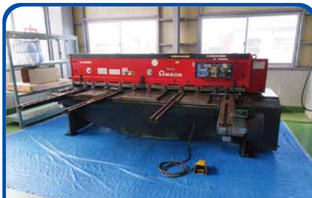
8尺×6mm メカシャーリング(アマダ) (高崎) 1997年 M-2560 280万円 税込308万円