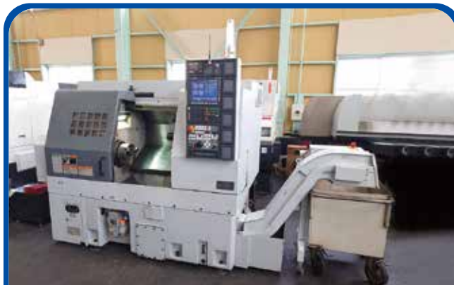
ドラム形NC旋盤(DMG森精機) (名古屋) 2014年 CL2000AT 制御 M730BM 580万円 税込638万円