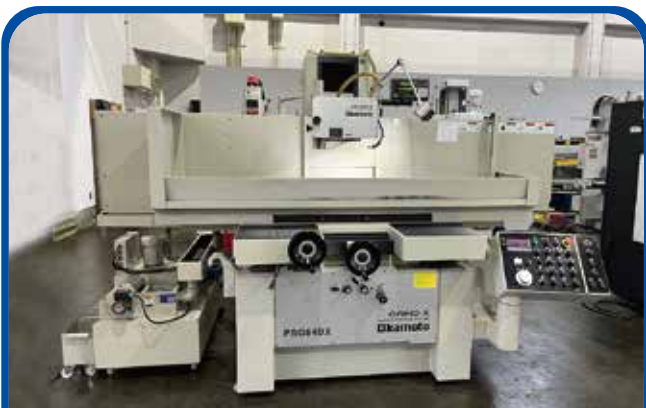
800mm×400mm 平面研削盤(岡本工作) (足立) 2018年 PSG84DX 800万円 税込880万円