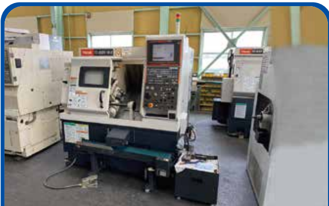
ドラム形NC旋盤(ヤマザキマザック) (名古屋) 2008年 QTN-100II 制御 MATRIX 350万円 税込385万円