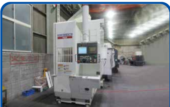
立形NC旋盤(大隈豊和) (大阪) 2003年 V-40R 制御 FANUC-18i-T 580万円 税込638万円