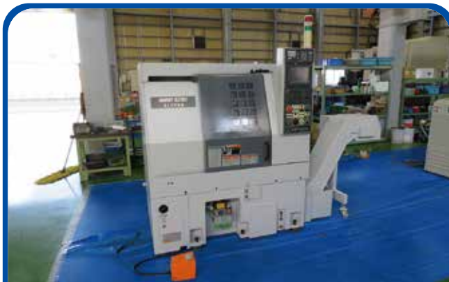
ドラム形NC旋盤(森精機) (高崎) 2007年 CL2000B 制御 MSC-805V 300万円 税込330万円