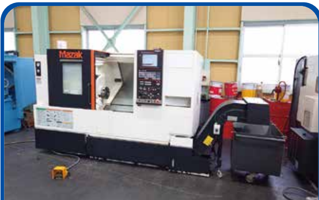
ドラム形NC旋盤(ヤマザキマザック) (名古屋) 2016年 QTS-200 制御 MAZATROL-smart 680万円 税込748万円