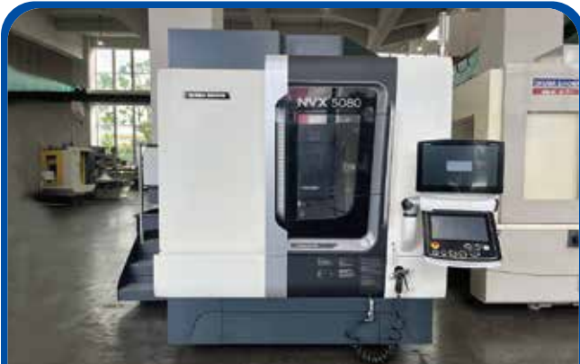
#40立形マシニングセンタ(DMG森精機) (足立) 2017年 NVX5080/40 制御 M730UM 1200万円 税込1320万円