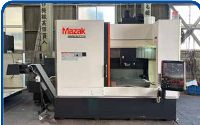
#40立形マシニングセンタ(ヤマザキマザック) (大阪) 2019年 FJV-250 制御 Smooth G 1200万円 税込1320万円