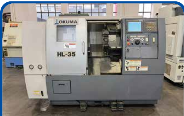
ドラム形NC旋盤(オークマ) (足立) 2007年 HL-35 制御 FANUC-18iTB 350万円 税込385万円