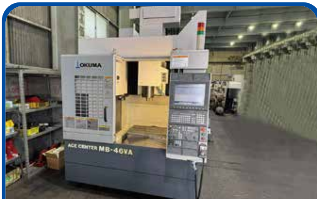
#40立形マシニングセンタ(オークマ) (大阪) 2010年 MB-46VA 制御 OSP-P200M 498万円 税込547.8万円