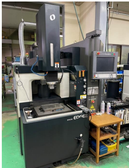
NO,9 NC放電加工機 マキノ