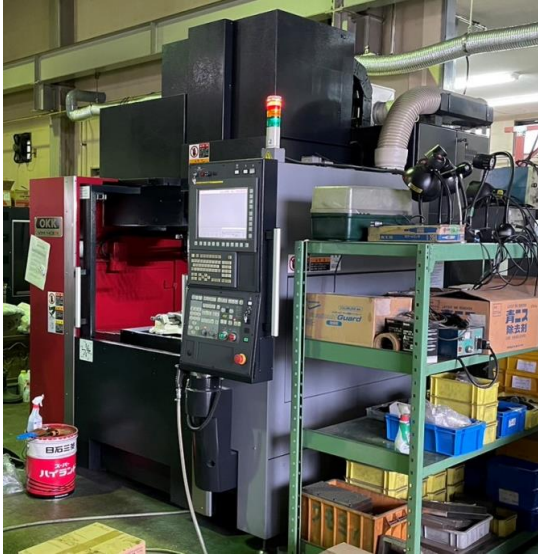
NO,11 立マシニングセンターOKK