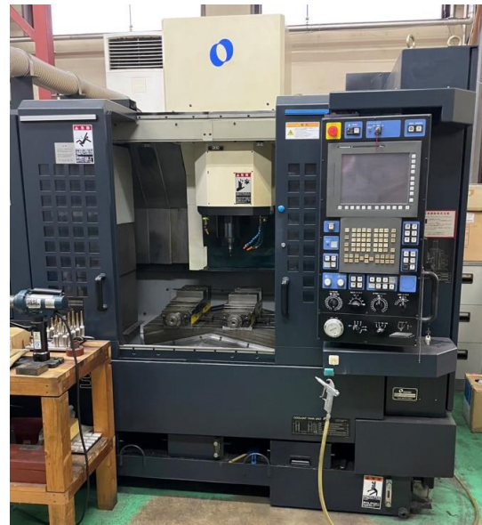
NO,1 立マシニングセンターマキノ