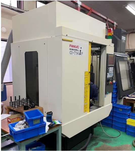
NO,3 立マシニングセンターファナック