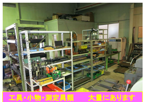
工具・小物・測定具類 大量にあります