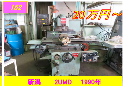
152 新潟 2UMD 1990年 20万円～