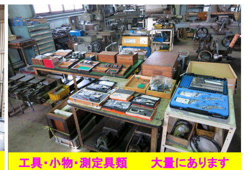
工具・小物・測定具類 大量にあります