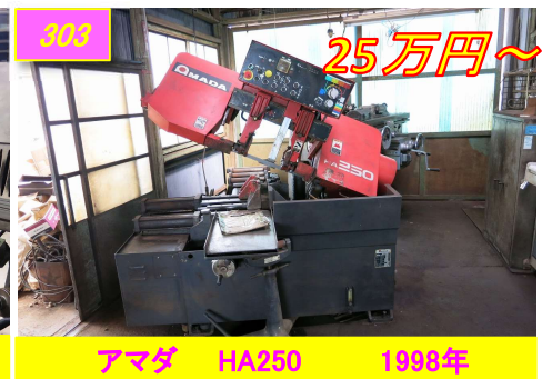
303 アマダ HA250 1998年 25万円～