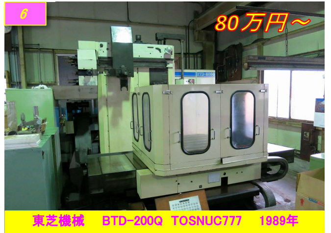
6 東芝機械 LTD-200Q TOSNUC777 1989年 80万円～