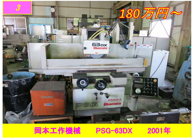
3 岡本工作機械 PSG-63DX 2001年 180万円～