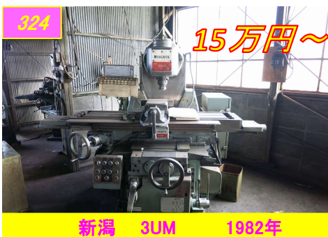
324 新潟 3UM 1982年 15万円～