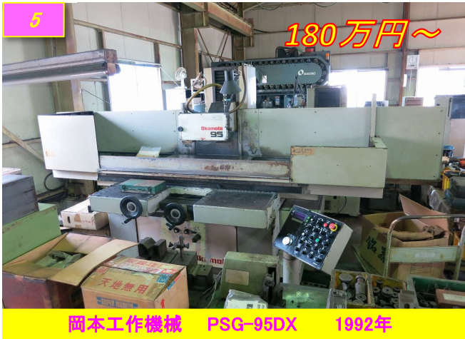
5 岡本工作機械 PSG-95DX 1992年 180万円～