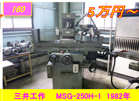
160 三井工作 MSG-250H-1 1982年 5万円～