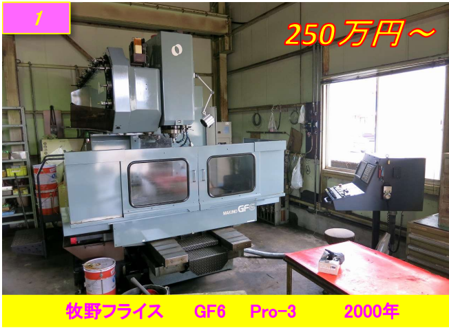
1 牧野フライス GF6 Pro-3 2000年 250万円～