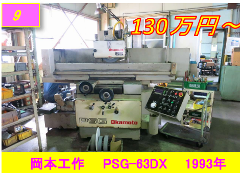
9 岡本工作 PSG-63DX 1993年 130万円～