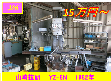
326 山崎技研 YZ-8N 1982年 15万円～