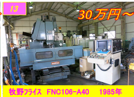
13 牧野フライス FNC106-A40 1985年 30万円～